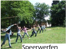
Speerwerfen wie die Legionäre