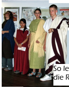
So lebten die Römer