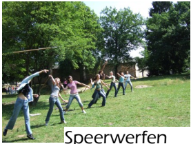
Speerwerfen wie die Legionäre